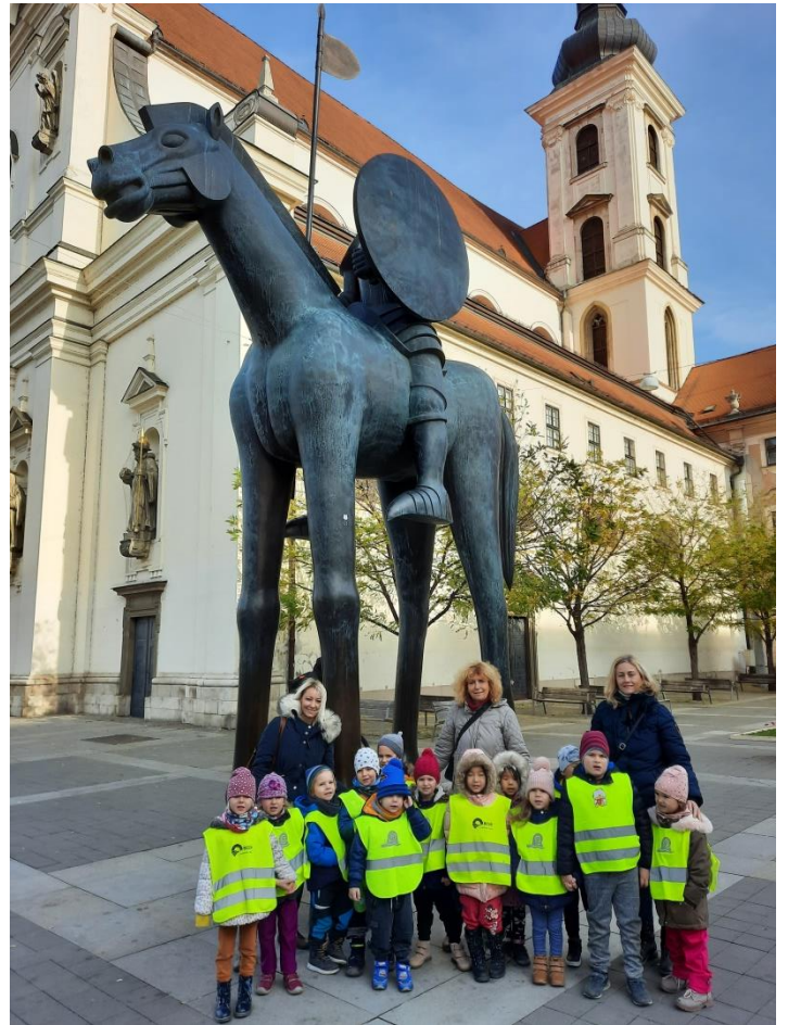
Všichni výletníci u sochy markraběte Jošta ↑