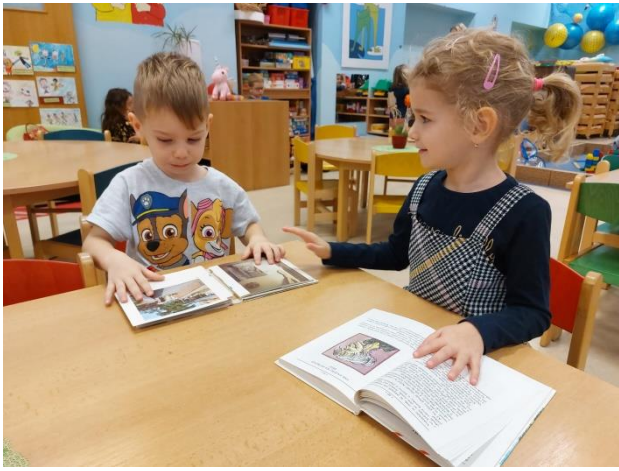
Při prohlížení knížek o Brně ↑