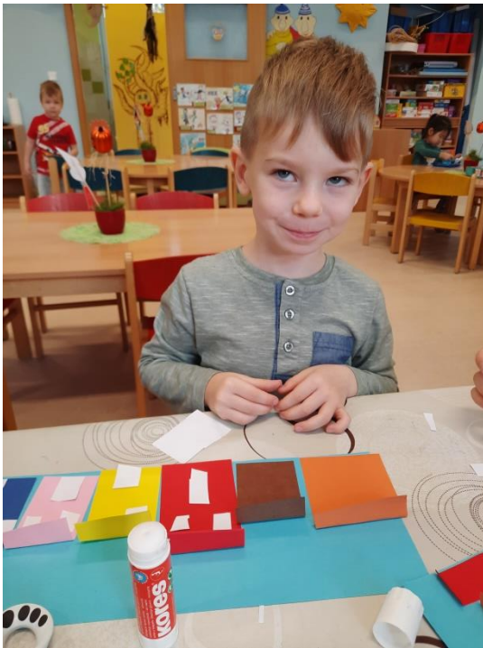
Tvoříme barevné brněnské domečky ↔